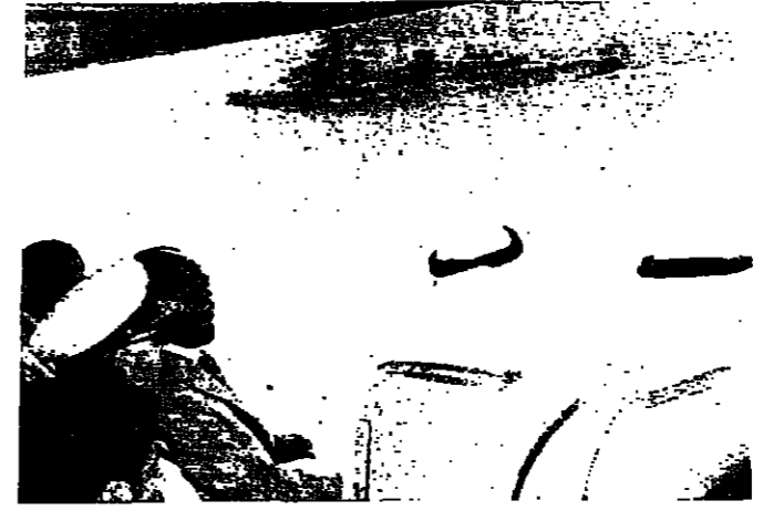
الملك خالد والسراييس السادات يفتحان المتاورات البحرية

نظم اتحاد الفروسية بعد ظهر امس في الميدان الرئيسي للجنة الرياضية ثلاث مباريات بقتل من الحواجز الثلاث ( د ، ج ، ب ) وفيما يلي النتائج الفنية : ● الفئدة د ( ١٢ حلجا بارفراع ١٢٠ بعد دورة تمليز بينها ملكة مع ساقية ماد صفرية ) فازت بالركب الاول كريستيان مابرو على سبيت فابر ( الحصان العربي ) دون خطأ ٢٧٠٠٦ نقطة . ● الفئدة ج ( نفس الحواجز مع ساقية كبيرة الارتفاع ١٢٠ دورة تمليز ) حل اولاً مكرم علم الدين على تركه ( الخيول ) ٤ اخطاء ٨١٠٠٤ نقطة . ● الفئدة ب ( نفس الحواجز بارفراع ١٤٠ بعد دورة تمليز مع ساقية كبيرة ) فاز بالركب الاول مكرم علم الدين على كاتيا ( الخيول ) دون خطأ ٨٧٠٠٤ نقطة . ويقيم الاتحاد اليوم في الساعة الرابعة بعد الظهر مباراتين بالفئتين الاولى للفئدة ( د ) والثانية مفتوحة لهما. الفئتين ج و ب على مرحلتين وتنبس النتيجة بجمع النقاط والوقت المرهتين .